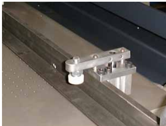
氣動式網版固定夾