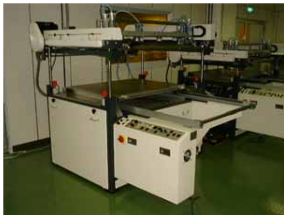
網版機構可垂直上昇 400mm , 以利清版動作。