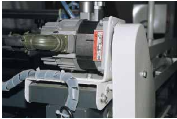
Heavy Duty 刮刀驅動伺服馬達