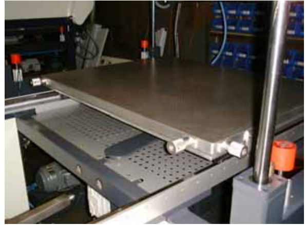
印刷桌檯面無間隙微調