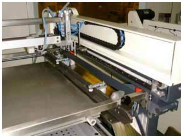
L 型網版座及氣動式網版固定 夾